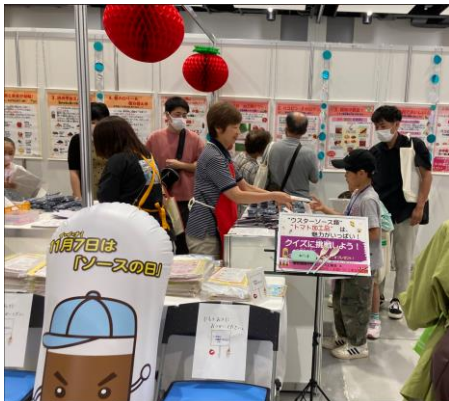
景品はカトラリーセット (スプーン、フォーク、お箸付)