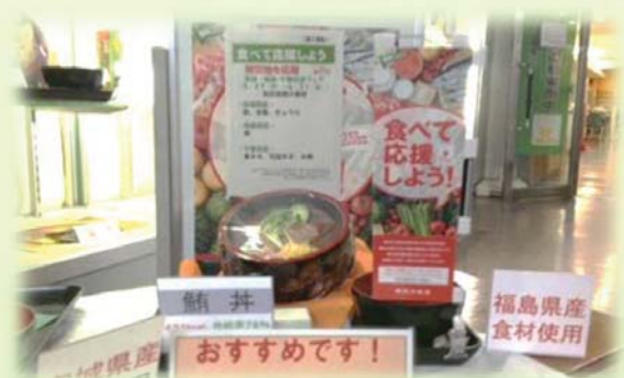
被災地産食品を使用したメニューの提供