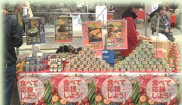
被災地産食品の販売フェア