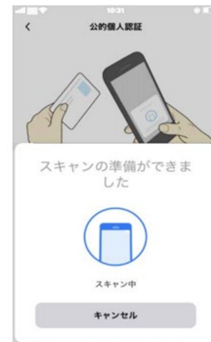
マイナンバーカード内のICチップを利用した本人確認

eMAFFの利用者である農林漁業者等の利便性が向上し、マイナンバーカードの取得促進が期待できる。また、農林水産省の職員等による本人確認業務の削減につながる。